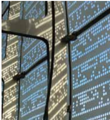
Cité de la Dentelle de Calais

Básico, emblemático, deportivo y urbano, origen, vivo, sorprendente, lavado, dinámico, luminoso, abstracto, tecnicidad, nómada, positive attitude, simplificado, radical, auténtico, idealista, one world.